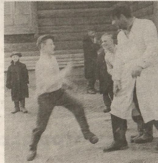
● Директор запросто мог поиграть со своими воспитанниками

или говорили друг о друге плохо. Папа звал маму только «Любушка». Умерла мама в 73 года в 1997 году, и сразу угас без неё отец. Каждое утро он, как закланье, повторял одни и те же слова: «Вечная память! Вечная память! Вечная память тебе, моя Любушка». Через два года отца не стало.