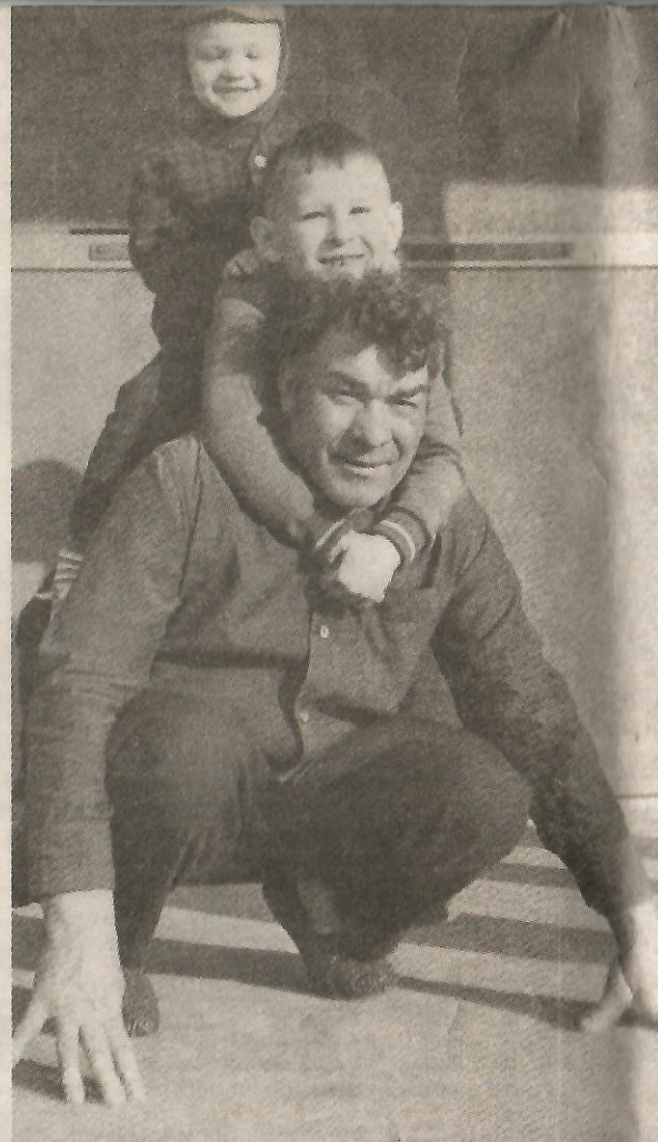
● Верхом на любимом дедушке

Отец начал работать в начальной школе учителем, а по-